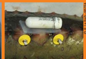
Balise à détacher du poisson capturé