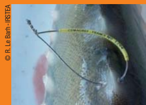
Marque externe à laisser sur le poisson capturé

5. Le déclarer par téléphone au 05 57 49 67 59 ou sur le site www.sturio.eu